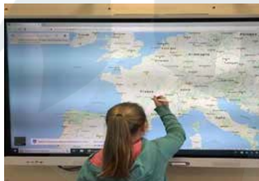
Les futurs tableaux numériques interactifs, qui entreront en service dès l'année prochaine

Dans cette perspective, l'ouverture d'un centre de loisir le mercredi serait un atout. Cette option n'est envisageable qu'à la