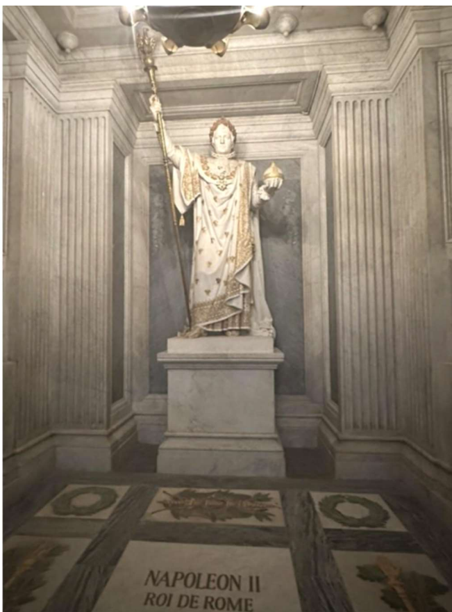
Tombeau du Roi de Rome

devoirs. En fin d'année, une cérémonie de remise d'insigne viendra saluer l'engagement des élèves et des familles les plus investis — un moment simple mais fort, pour célébrer l'éducation au civisme et le plaisir d'apprendre ensemble.