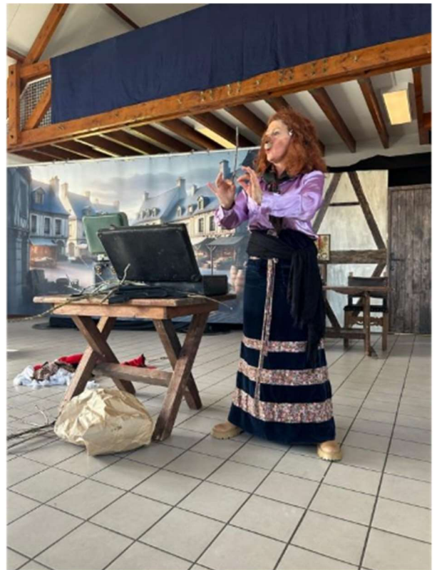
Spectacle « Ça coule de source » par la compagnie Un Coin de théâtre

l'écoute du public. Leur travail prend toute sa