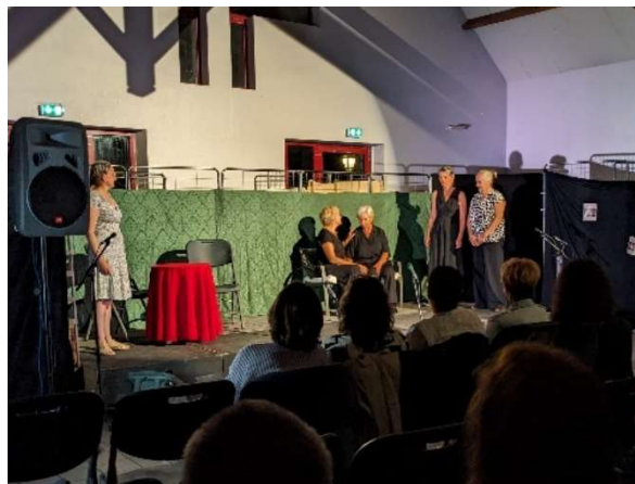
Comédie musicale « Le Secret » par la compagnie Incantata

Souhaitons que les prochaines éditions attirent davantage de curieux : le festival « Les Mots en l'Aire » reste une belle invitation à découvrir le théâtre, la musique et la joie du spectacle partagé