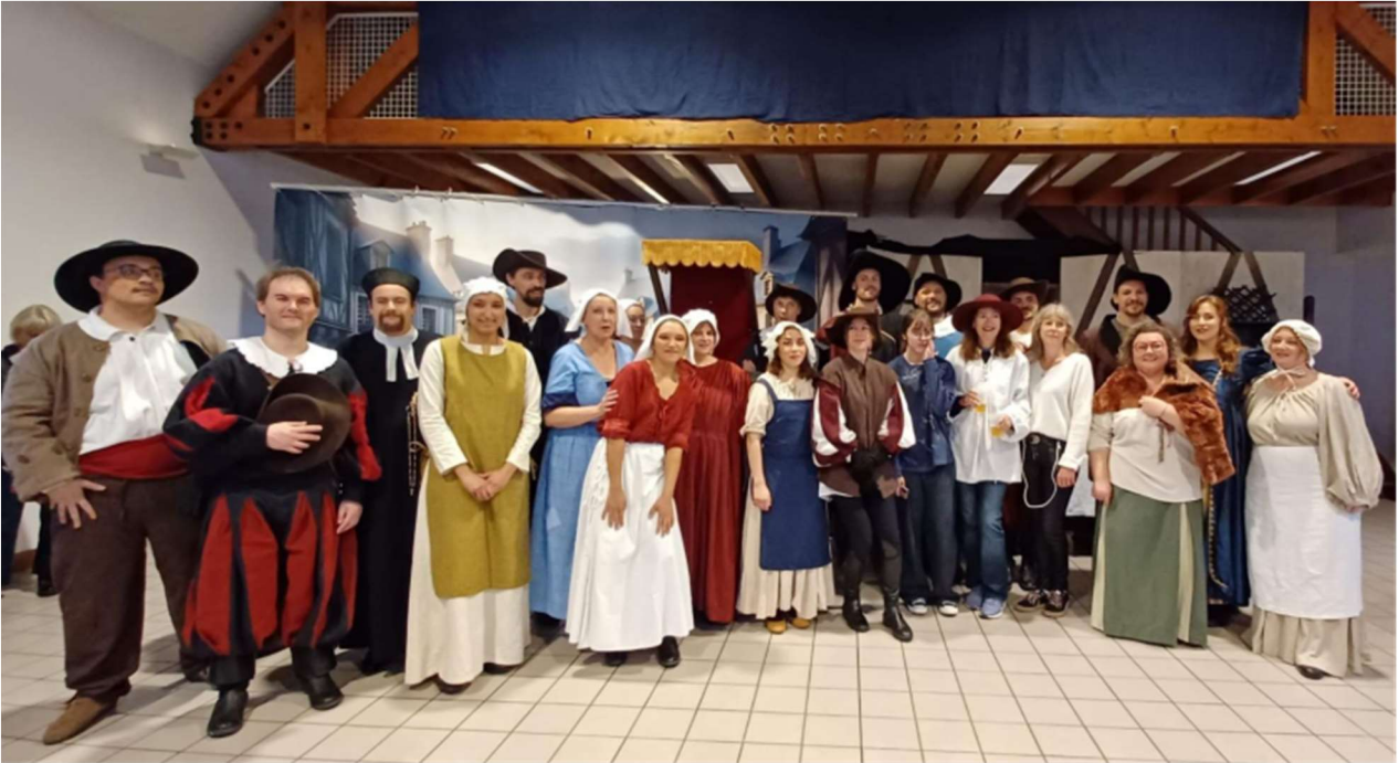
Spectacle « Sacré Pathelin ! » par la troupe Légende

La salle des fêtes de Mortefontaine a accueilli, dans le cadre du festival « Les Mots en l'Aire », quatre spectacles d'une grande qualité : une comédie enlevée, un « one woman show », une pièce pour les enfants, une comédie musicale pleine d'énergie. Chaque spectacle a révélé le talent et la passion des artistes venus à la rencontre du public.