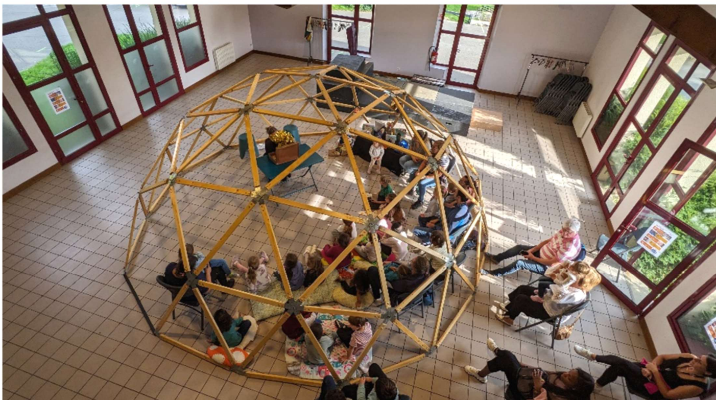
Spectacle « La Cabane magique » par la compagnie Préfabriquée.