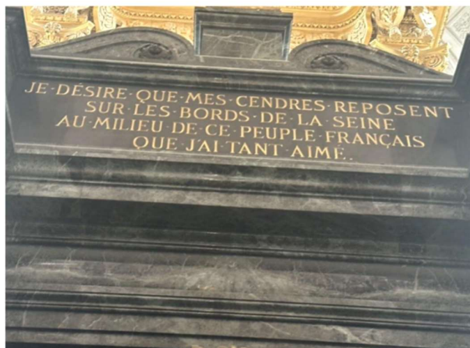
Tombeau de Napoléon Bonaparte