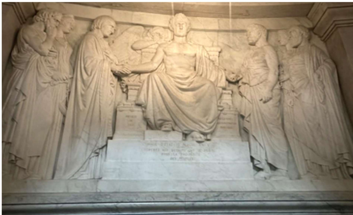
Bas-relief du tombeau de Napoléon 1er