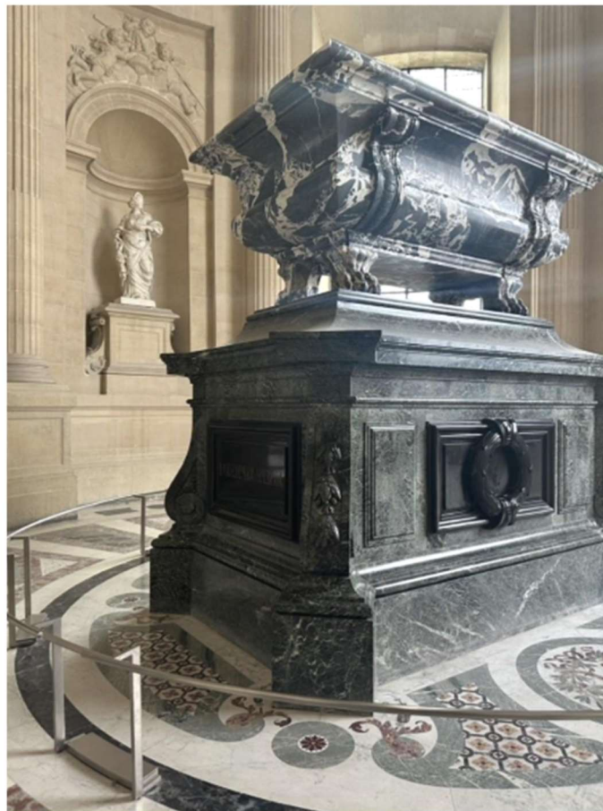
Tombeau de Joseph Bonaparte