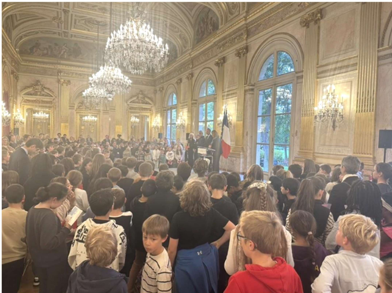
Réception par la présidente de l'Assemblée nationale

des valeurs fortes : le respect, la mémoire, l'engagement et la responsabilité.